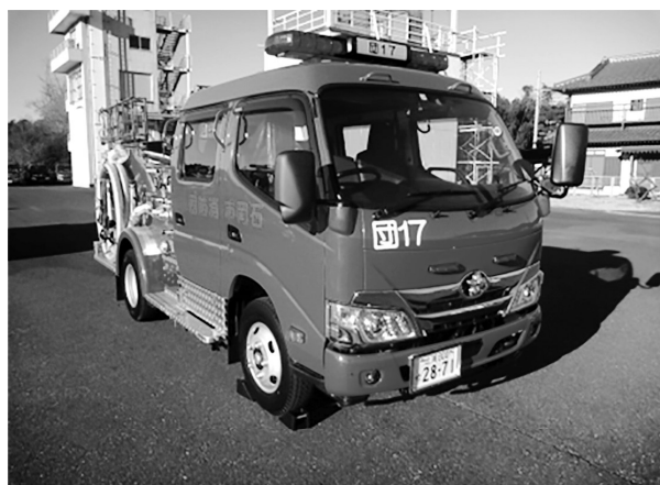
小型ポンプ積載型ポンプ車

ポンプを使用した消火活動を行うことができ、消防水利や河川等の自然水利を活用し可搬ポンプでの消火活動も可能な消防車両です。