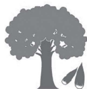
市の木 しい (平成17年10月制定)