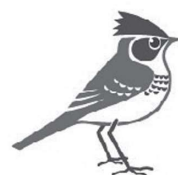
市の鳥 ひばり (平成17年10月制定)