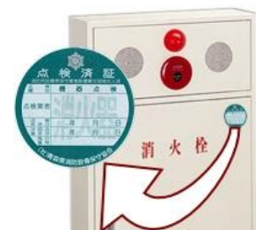
表示登録会員が点検し、機能が正常である証（ラベル）

この制度で認可された点検業者（ 表示登録会員 ）は、適正・適格な点検を実施していると認められた点検業者であるため、点検業者を選ぶ際は参考にして下さい。